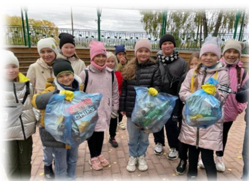
Традиционные средники и субботники