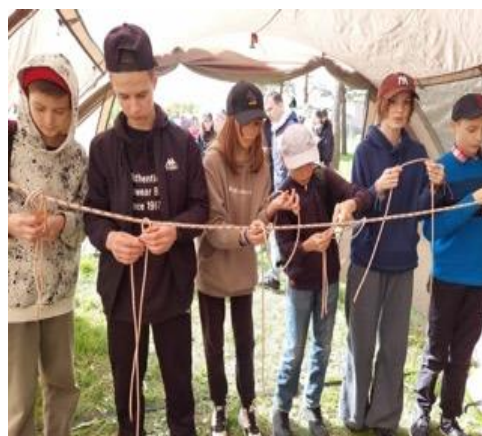
Центр туризма «Юлдаш»