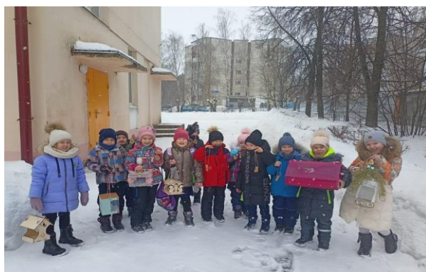
«Покормите птиц зимой»