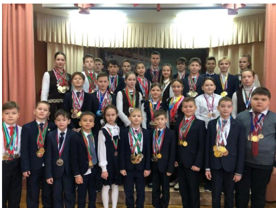
Лучшие спортсмены гимназии

2022-гимназисты победители Гранта Главы ЕМР РТ «Веселые старты»