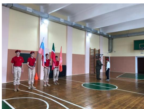
Посвящение в юнармейцы