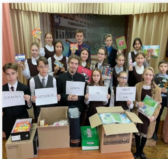
Акция «Твори добро» по сбору канцтоваров для детей с ОВЗ ООО «Планета добра»