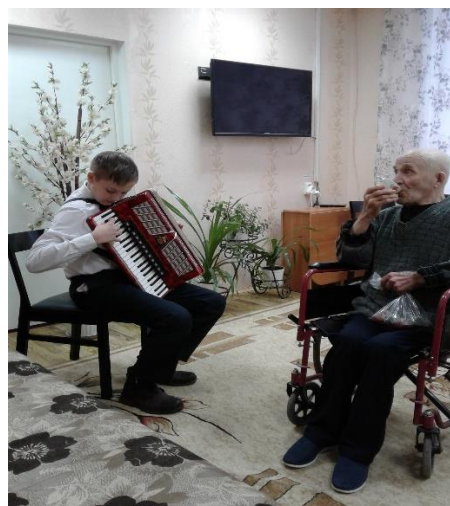
Благотворительные концерты в Доме ветеранов