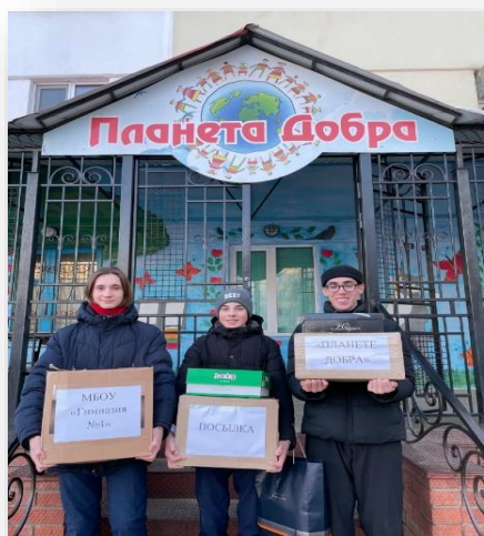
ОО для детей с ОВЗ «Планета добра»