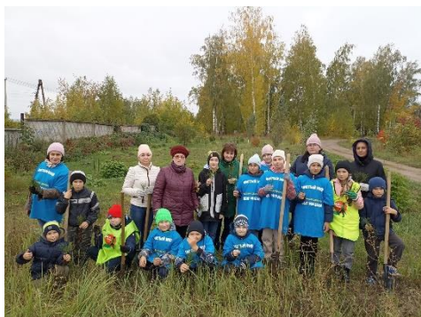
Сотрудничество Национальным парком

Гимназия активно сотрудничает с общественными организациями «Национальный парк «Нижняя Кама», «Планета добра», «Совет ветеранов ЕМР», ТОС «Буровик», Молодежный центр «Барс», центр туризма «Юлдаш», приюты для животных «Девять жизней» и «Доверие», что позволяет еще более эффективно участвовать в социально-значимых мероприятиях.