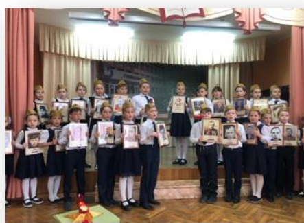
« Битва хоров»