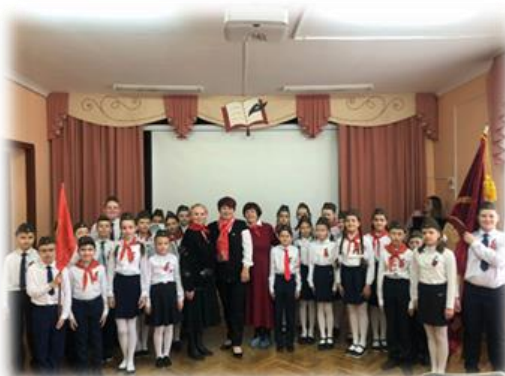
Встреча с ветеранами гимназии