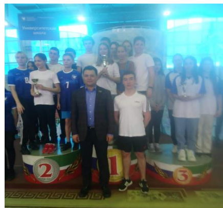
Грант Главы ЕМР РТ- 1 место