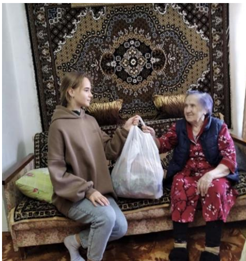
Акция «Помощь пожилым людям»

Акции, проекты: «Помощь четвероногим друзьям», «Твори добро», «Помощь пожилым людям», «Неделя добра».