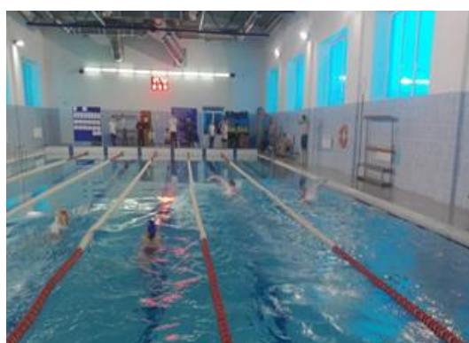
«Веселые старты (плавание)»