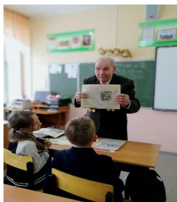
Уроки мужества с ветеранами