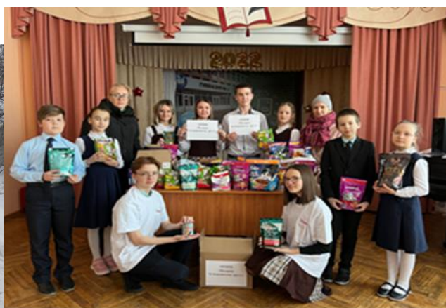
Сбор корма для животных