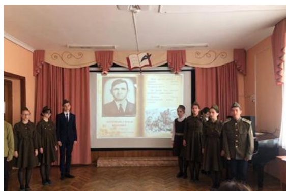
Выступление отряда «Форпост»