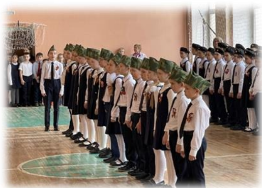
«Смотр строя и песни»

Ежегодно проходят общешкольные мероприятия «Смотр строя и песни», «Битва хоров», «Уроки мужества» с участием членов Совета ветеранов города, встречи с ветеранами гимназии , реализация проектов «Пионеры-герои!», «История моей семь в годы войны», работают отряды «Форпост» и ЮИД.