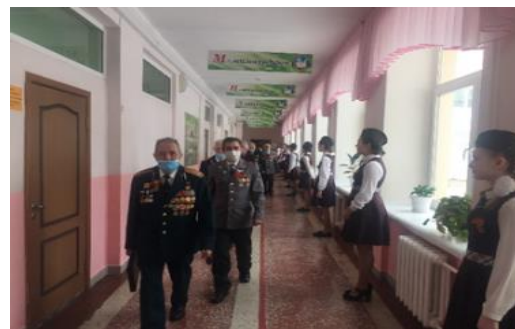
Совет ветеранов ЕМР РТ