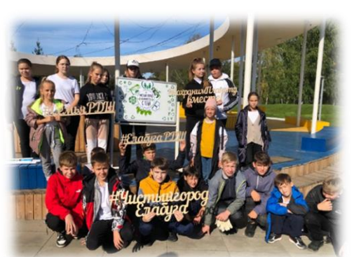
Ежегодный экологический марафон «Чистый город»